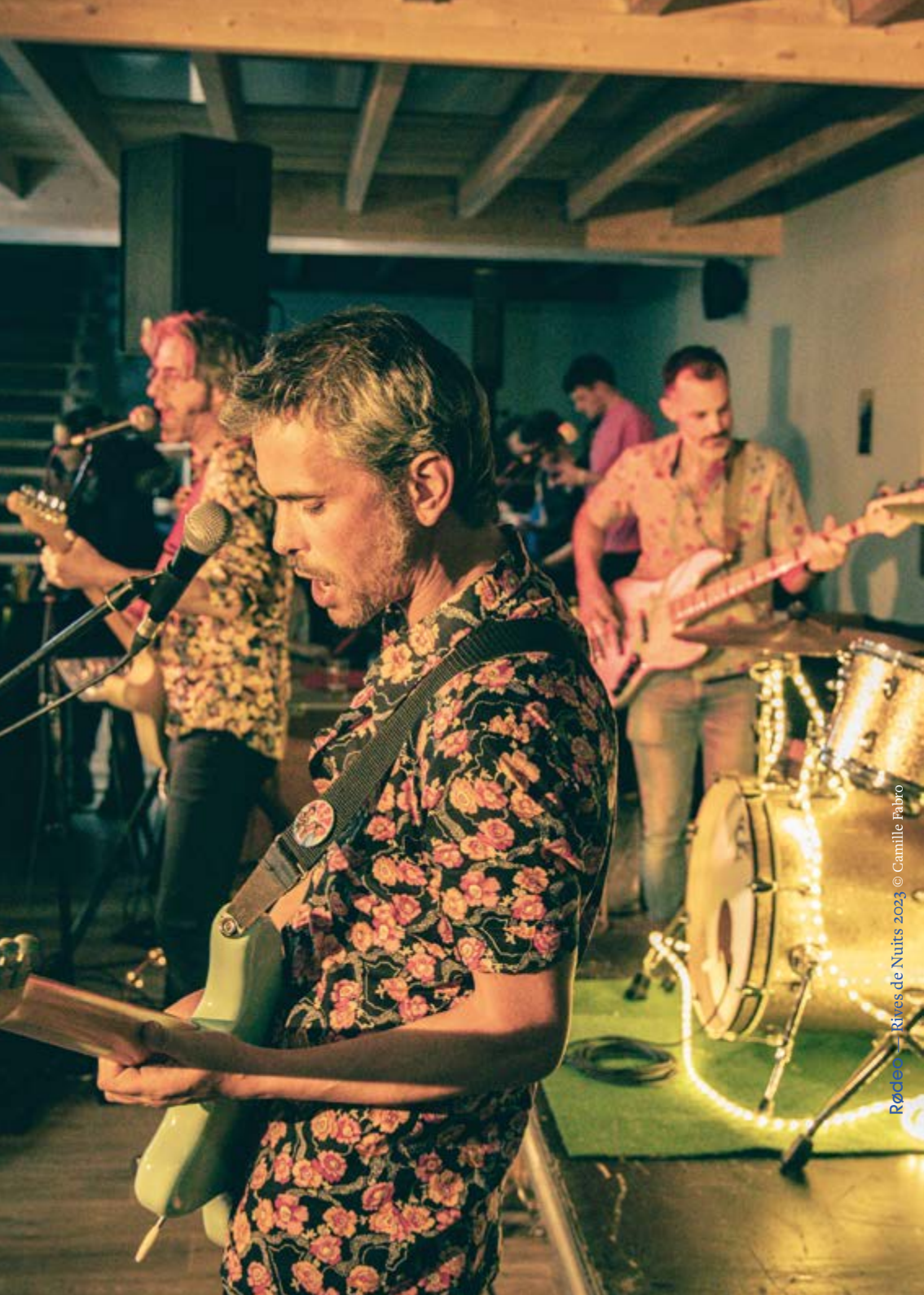
Rocles - Rives de Nuits 2023

Du jeudi 30 janvier au dimanche 2 février